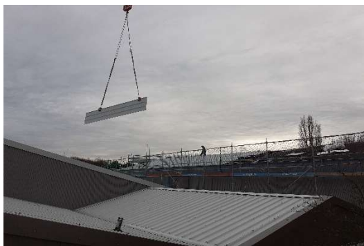
Transport u Montage Dachpaneele