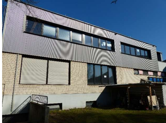
Gebäude Westseite nachher