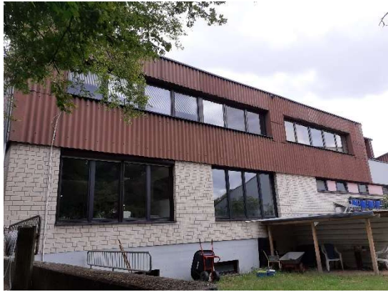
Gebäude Westseite vorher